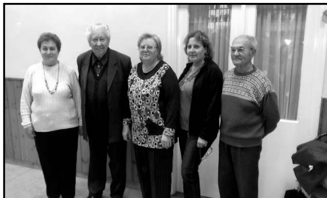
A Cserhályi Nyugdíjas Klub vezetősége

Polgármester úr is kitért arra mondandójában, hogy a nyugdíjasok mennyire aktív és hasznos tagjai a cserhályi közösségnek. Hozzáállásuk és